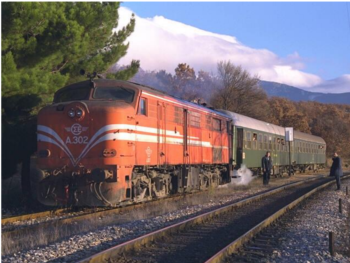
de trein van Thessaloniki naar Kozani in de ochtendzon

Wellicht niet zonder reden, bracht Helena Papatizou , Eurovision winnares 2006, haar nieuw album "Iparchei Logos" ("Er is een reden") eind april 2006 uit. Het is een dubbel-album met 29 songs, waarvan 19 nieuw. Eén van de songs, Mambo, zal zeker ook in België gepromoot worden. Een nieuw internationaal album van Helena zou in september moeten gereed zijn. Daarop 5 nieuwe songs geschreven door Zweedse componisten en 5 songs van bovenvermeld album "Iparchei Logos", maar met Engelstalige liedjesteksten.