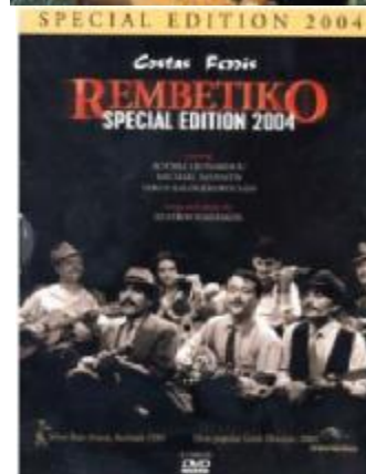
L'Histoire du rebetiko “Most popular Greek film ever” 2 DVD