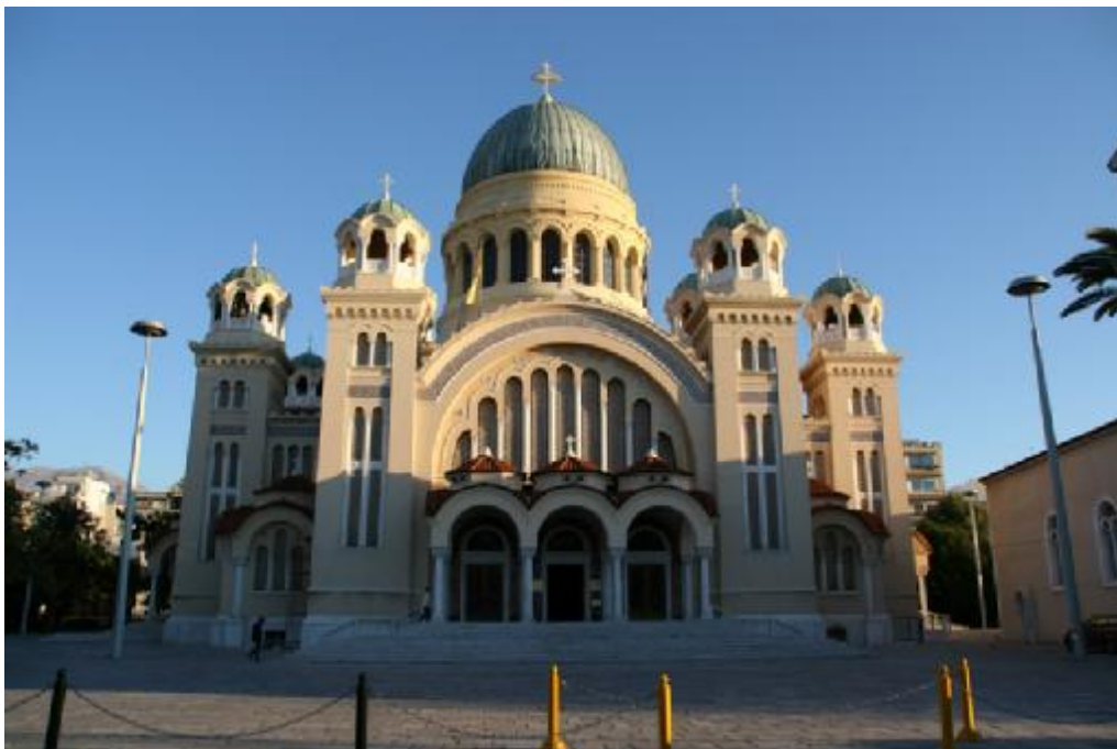
Patras: de Sint Andreas kerk

van het culturele jaar was alvast het carnaval dat de stad van 21 januari tot 5 maart inpalmde. Elk jaar gaan 50.000 feestvierders zich te buiten aan verkleedpartijtjes. Patras is trouwens de enige plek in Griekenland waar een carnavalsfeest naar westers model wordt gevierd. De eeuwenlange invloed van de Venetiaanse en Italiaanse cultuur is daar niet vreemd aan. In de lente staan poëzie en muziek in de kijker. Van mei tot juni volgt een programma van Griekse tragedies en komedies in een Romeins amfitheater. In november zijn kunst en religie aan de beurt met Byzantijnse icoon- en schilderkunst.