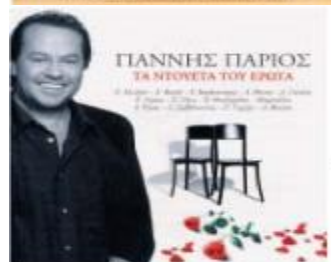
Giannis Parios Ta Dueta tou Erota 19 songs