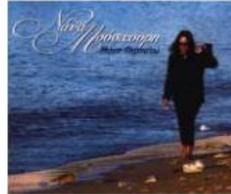
Nana Mouskouri Moni Perpato Nieuw album + tekstboek