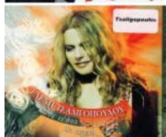
Tsaligopoulo Kathe telos kai archi