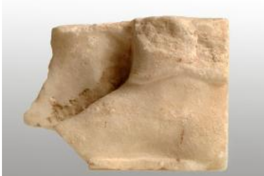
dit stukje meet 11cm op 8 cm

Giorgos Voulgarakis verklaarde dat de hereniging van de Parthenon-sculpturen gebaseerd is op morele waarden en niet op een nationale dwang. Hij voegde eraan toe dat de Duitse teruggave wellicht een wereldwijde controverser tussen de museums zal uitlokken. In 2002, toen de onderhandelingen over de terugkeer van de stukken bezig waren in het Salinas Regional Archeological Museum in Palermo op Sicilië, waarschuwden directeurs van diverse beroemde musea dat teruggave het ganse museumsysteem wereldwijd zou destabiliseren.