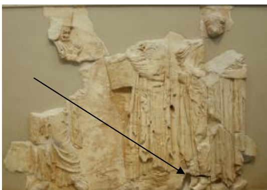
de pijl duidt aan waar het stukje thuishoort

Op 8 september werden twee clandestiene Koerdische immigranten gedood en een derde zwaar gewond door landmijnen die op de grens tussen Turkije en Griekenland liggen. Sedert 1994 werden in totaal 82 migranten gedood en 69 gewond. Het mijnenveld is nochtans dubbel afgebakend met prikkeldraad en tal van felgekleurde waarschuwingsborden in diverse talen. Griekenland plaatst sinds 1974 mijnen op de grens met Turkije. Athene en Ankara ondertekenden in 2003 een verklaring waarin staat dat de mijnen tegen 2011 opgeruimd moeten zijn.