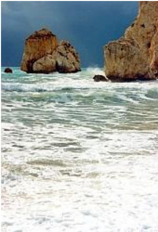
<< De rots van Aphrodite, het beginpunt van de tocht

Thubron is ook recensent bij The Times, The Times Literary Supplement en The Spectator. Enkele maanden geleden werd hij benoemd tot 'Commander' van de Orde van het Britse Empire.