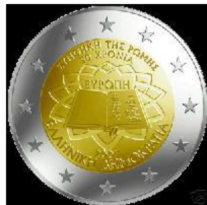
Griekse speciale euromunt 'Verdrag van Rome - 50 jaar'

In Griekenland zullen 4 miljoen speciale euromunten uitgegeven worden