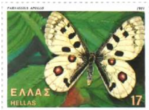
Parnassius Apollo op een Griekse postzegel uit 1981