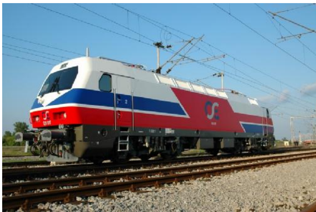
een nieuwe moderne lokomotief van de OSE, de Griekse spoorwegen