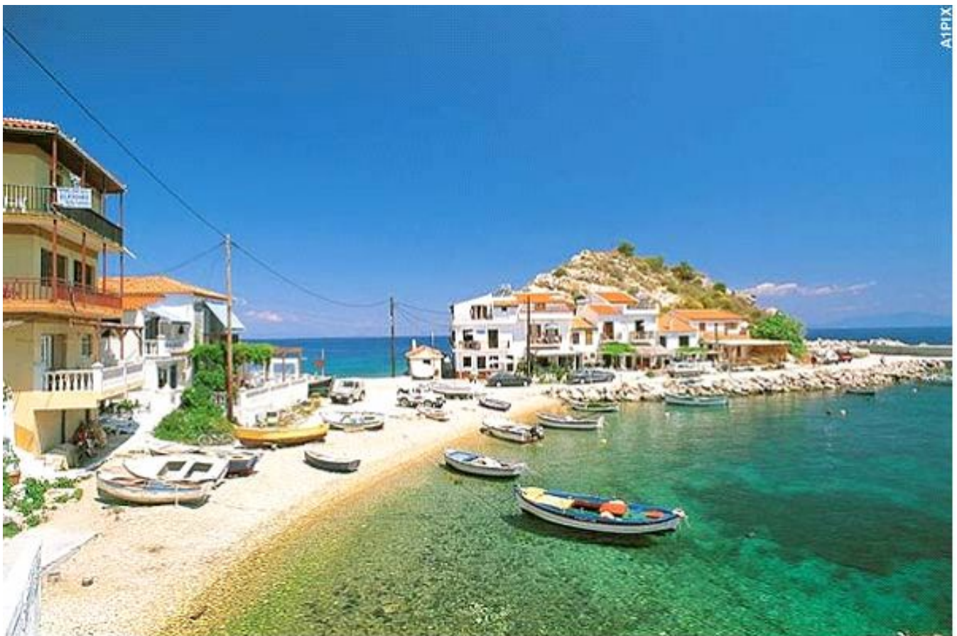
Haven van Kokkari, Samos