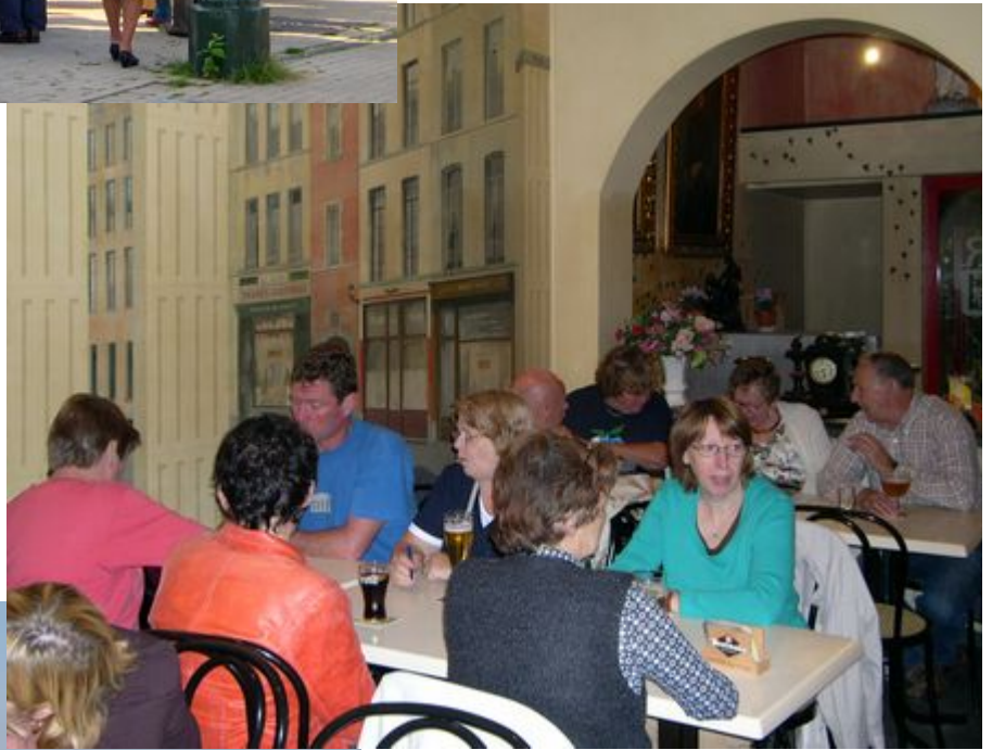
In café "Den Skieven Architek" >>>