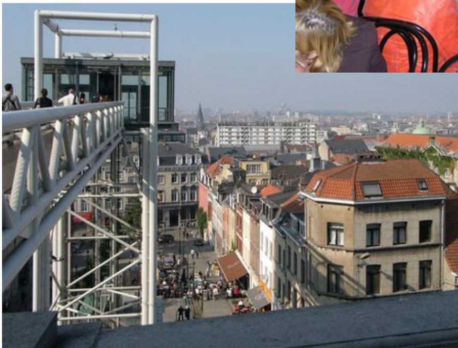
<<< de lift aan het Poelaertplein en zicht op Brussel