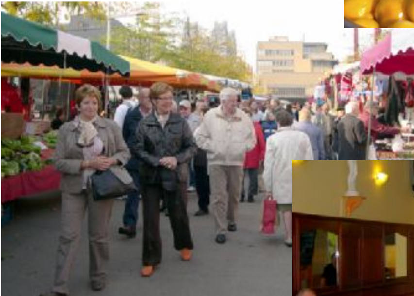
<<< de kraampjes afflopend