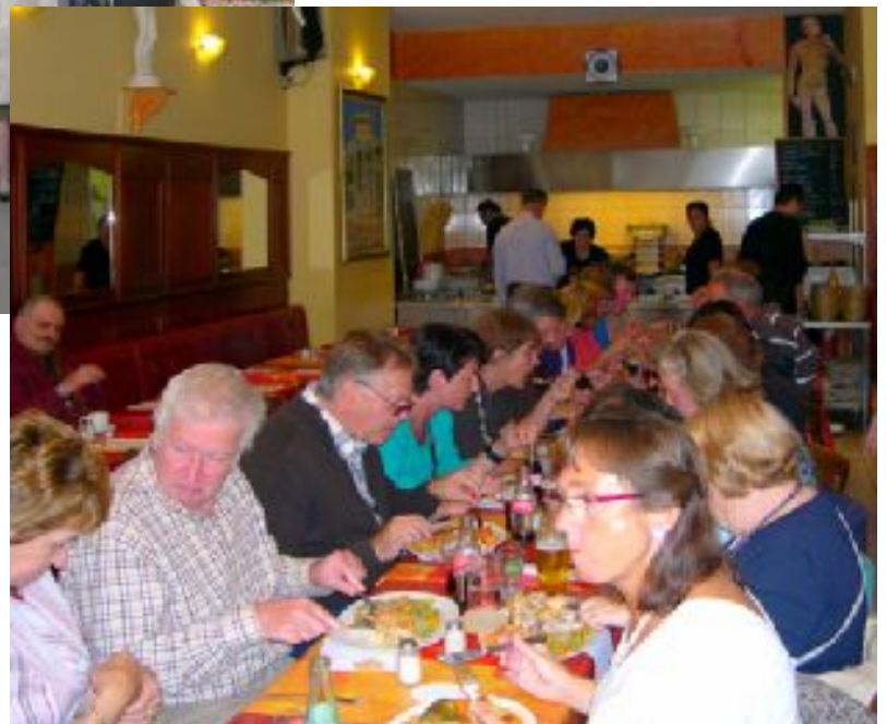
in restaurant Atanas >>