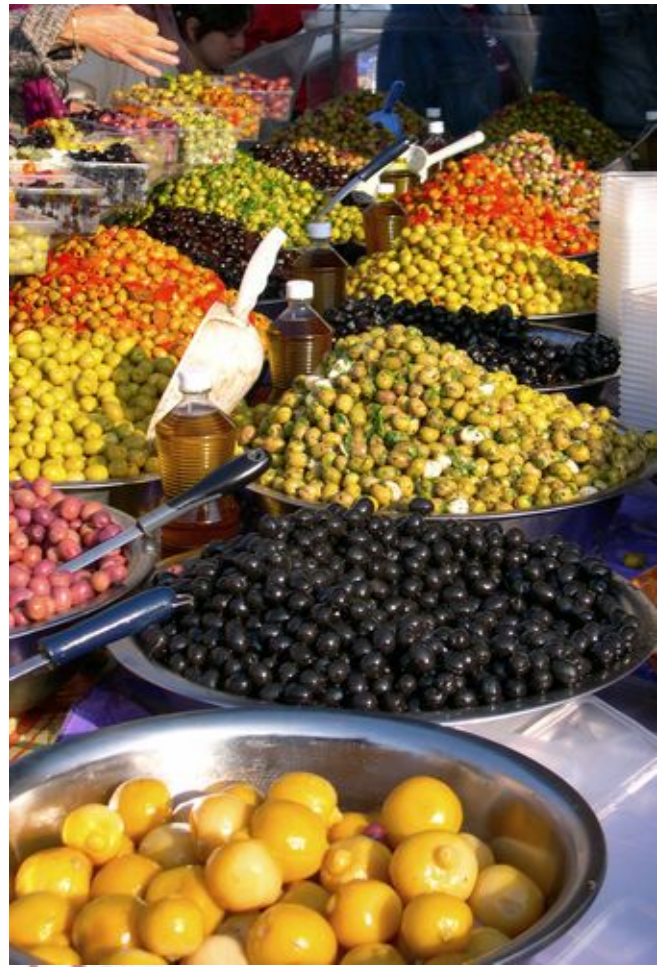
keuze te over aan olijven >>>

Na het laatste stuk van de rondleiding strandden we in café De Skieven Architek, waar de meesten zich te goed deden aan het plaatselijk biertje. Na deze mooie dag keerde iedereen bijzonder tevreden naar huis.