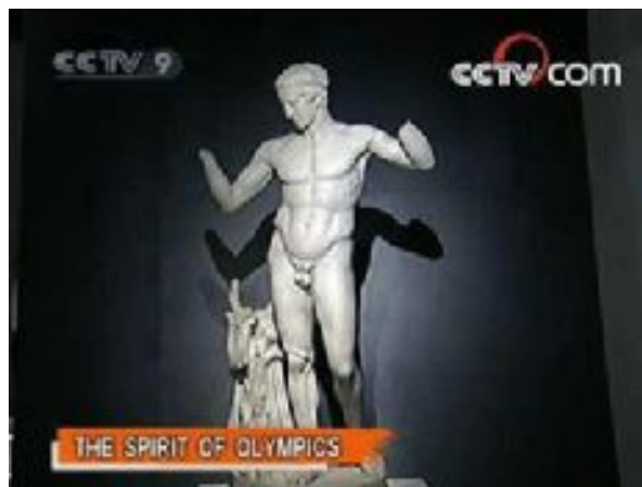
The Spirit of Competition in Ancient Greece