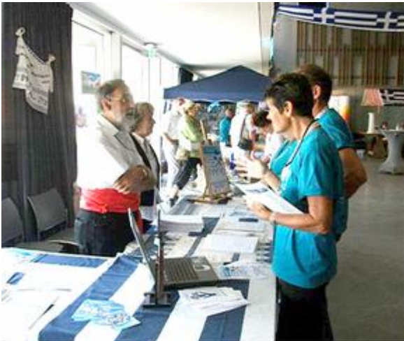
De infostand van Eleftheria Paralias vzw

groot en klein. In de zaal stonden verscheidene standjes met allerlei Griekse koopwaar, reis-informatie, schilderijen, CD's, boeken, t-shirts. Natuurlijk ontbrak ook onze vereniging niet met een stand. Buiten kon men zich aan de verschillende kraampjes tegoed doen aan Griekse eet- en drinkwaren. Deze jaarlijkse traditie zorgde dan ook voor heel wat ambiance in en rond de zaal. Een dikke proficiat voor de initiatiefnemers en alle enthousiaste vrijwilligers.