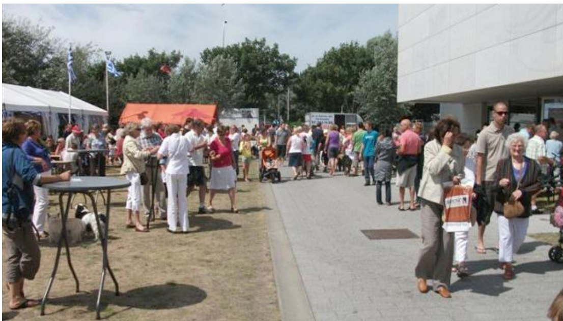
Ook in open lucht heel wat kraampjes en belangstellenden

In de volgende Nea Paralias (januari 2011) brengen wij u beelden van het 'Ledenfeest' en het bezoek aan de 'Dolle Brouwers'.