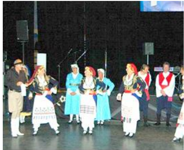
Dansgroep Eleftheria Kiniseos