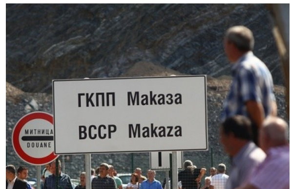
Grenspunt Makaza was gesloten sinds het einde van WO II in 1945.

Bedienden in de openbare sector die met een computer werken konden meer dan twintig jaar lang genieten van zes betaalde verlofdagen extra per jaar. Aan deze gunstmaatregel voor 600.000 werknemers is in september een einde gekomen als onderdeel van de besparingsmaatregelen.