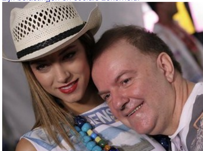
Aslanis aan de zijde van model Doukissa Nomikou in oktober 2007

Eind augustus overleed Michalis Aslanis, een prominent Grieks mode-ontwerper van de voorbije 40 jaar. Hij werd 63 jaar en was de bekendste van de oude garde wiens reputatie hoofdzakelijk in eigen land is beperkt. Zijn dood kwam een week nadat hij aan een Griekse krant had verteld bedrogen en geruïneerd te zijn door twee nieuwe assistenten die hij had belast met het betalen van zijn belastingen en sociale zekerheid.