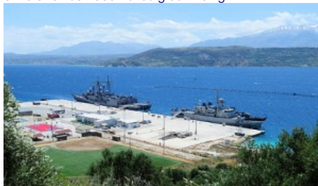
de baai van Souda

In Souda in het westen van Kreta is sinds lang een gezamenlijk Grieks-Amerikaanse marinebasis voor onderhoud en bevoorrading. De installatie dient als een vooruitgeschoven strategisch gelegen basis met een diepwaterhaven voor Amerikaanse en geallieerde operaties in en rond de Middellandse Zee, bijvoorbeeld de interventie de voorbije maanden in het Midden-Oosten. De Naval Support Activity Souda Bay telt 1.100 personeelsleden en ligt op een terrein van 110 hectaren aan beiden kanten afgeschermd door bergen. In het verleden werd de 9 mijl lange baai al gewaardeerd door Venetianen, Ottomanen en Duitsers (de haven werd gegrondvest in de 7de eeuw vóór Christus als Aptera). Binnen de basis is er ook een vliegveld en er is een aanlegpier voor NAVO-duikboten. De Amerikaanse aanwezigheid begon officieel in 1969 en is er sinds 1980 volledig aanwezig.