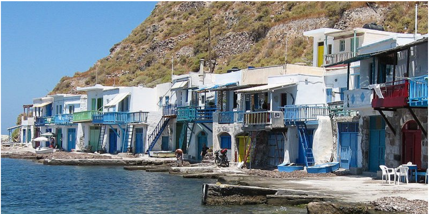
Vissersdorp Klima