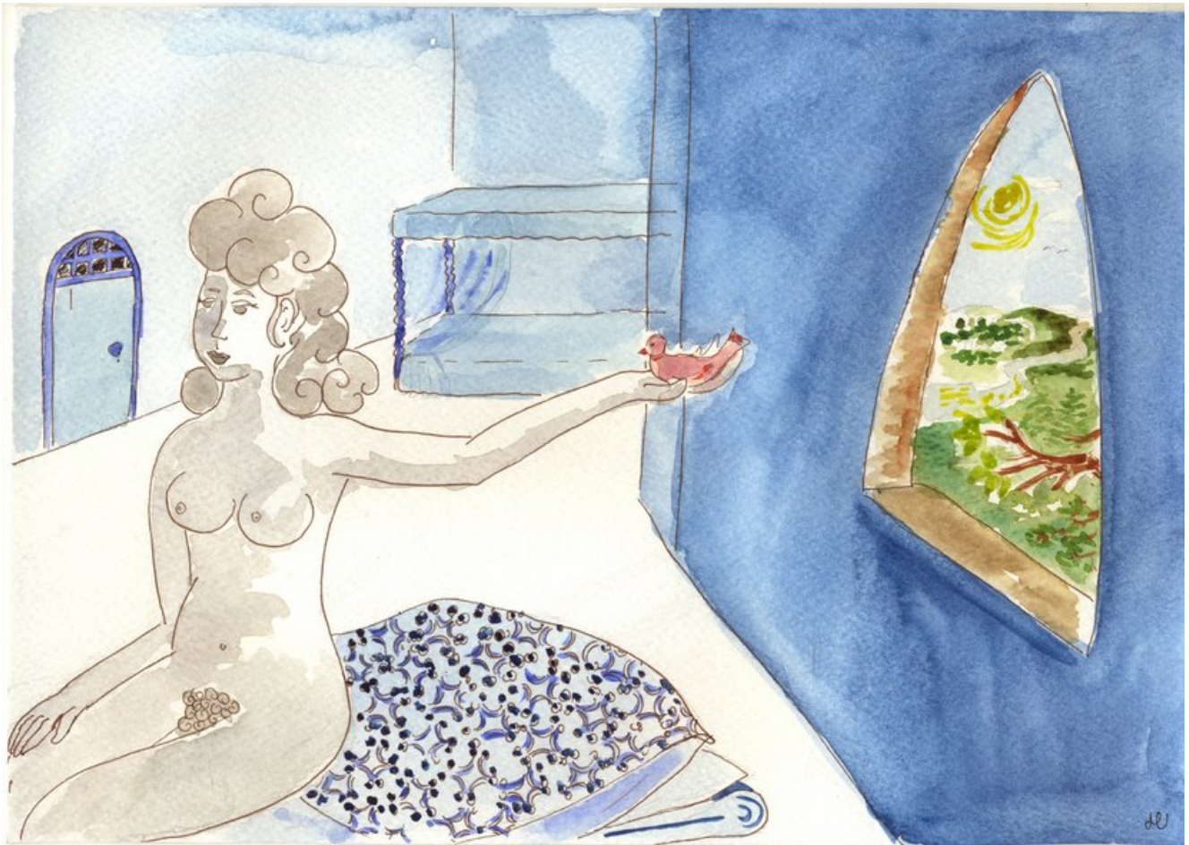
illustratie: H. Isikli

Ik heb het allemaal aan jou gegeven, niets heb ik gehouden, want jij in mijn leven, alleen jou had ik lief.