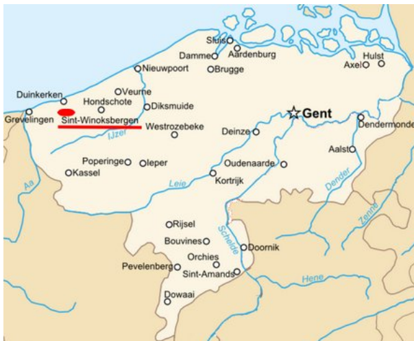
Vlaanderen in een ver verleden

We raden aan enkele zeer interessante artikels over de geschiedenis, het burgerlijk en kerkelijk erfgoed te lezen op http://nl.wikipedia.org/wiki/Sint-Winoksbergen , U leest er ook wat de link is met Brugge.