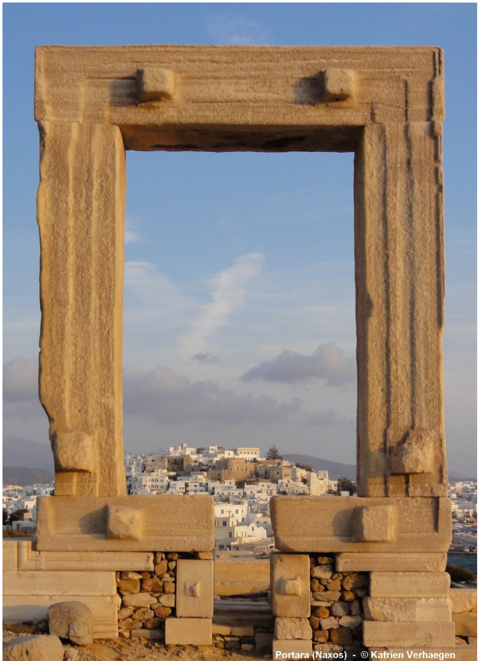
Portara (Naxos)