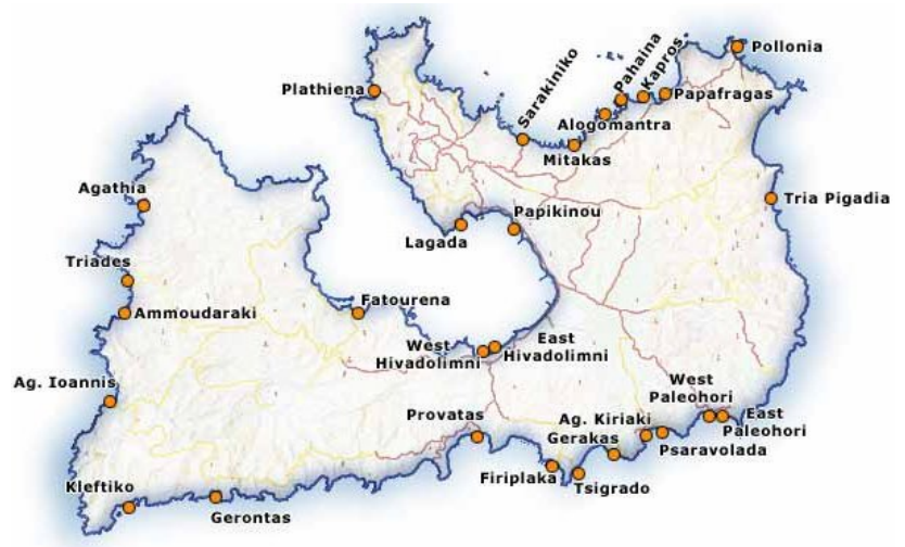
Milos is gemakkelijk te herkennen aan de hoefvorm

Er zijn ongeveer 70 stranden op Milos. Het grootste ligt in Hivadolimni en is ongeveer 1 kilometer lang. De noordelijke en zuidelijke stranden zijn toeristische trekpleisters. De westelijke en vooral oostelijke stranden zijn moeilijk bereikbaar en bijgevolg zeer rustig.