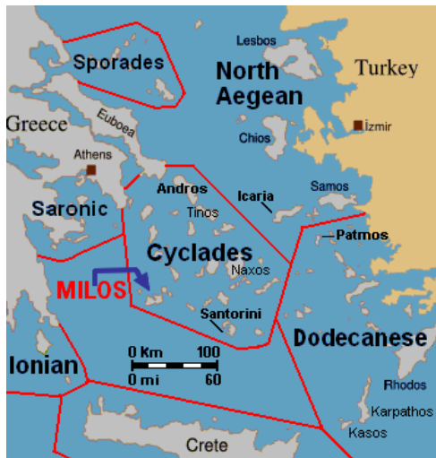
Milos ligt ongeveer halweg Athene – Kreta

Zie http://nl.wikipedia.org/wiki/Diagoras_(persoon) en http://en.wikipedia.org/wiki/Antonio_Vassilacchi