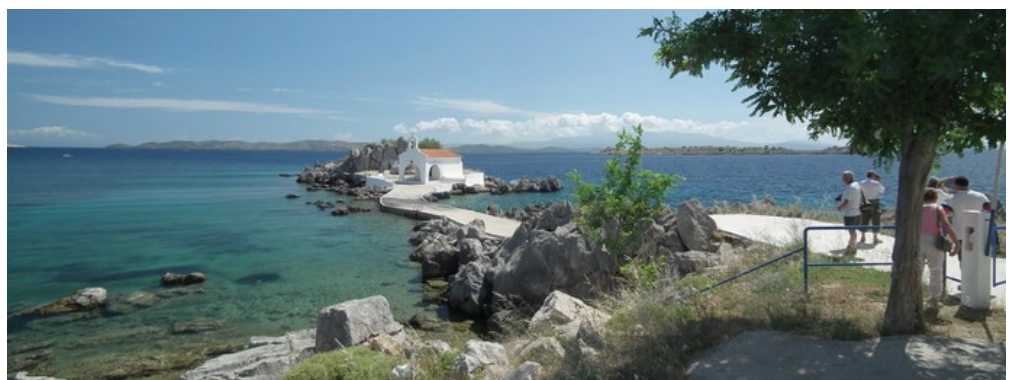
Ontegensprekelijk: idyllische schoonheid van Chios...

Aangezien de zon niet goed zit en we willen wachten tot de zon meer naar het zuiden gaat in het belang van de fotografie, besluiten we om terug naar de Kambos te gaan. We vinden dit keer wel het citrusmuseum. We zien er ook een hoge boom die uitmondt in een scherpe punt en die bedekt is met een netwerk van lampjes. Wat moet dit mooi zijn als het donker is en de lichtjes branden. Zouden ze hier al kerstmis vieren? Vervolgens rijden we terug naar Vrondados waar we nog even een fotostop houden. Niet vermeld in de boekjes is het Agios Isodoroskerkje dat op een rotsachtig schiereiland ligt. Enig mooi (foto hieronder).