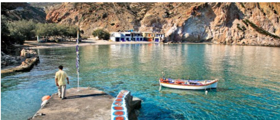
Sirmata in Fyropotamos – © Danos Kounenis voor EP

Arkoudes (Αρκούδες) zijn de groep van rotsachtige eilandjes gelegen voor de kust van Milos. De rotsen lijken een open mond te laten zien, met een neus, ogen, oren en een lichaam die er eerder uitzien als beren, vandaar hun naam. De rotsen zijn ongeveer 20 meter hoog en de enige manier om ze te bekijken is per boot die tochten rond het eiland maakt. De natuurlijke sculpturen zijn in de buurt van Plathenia Beach en de ingang van de baai van Milos.