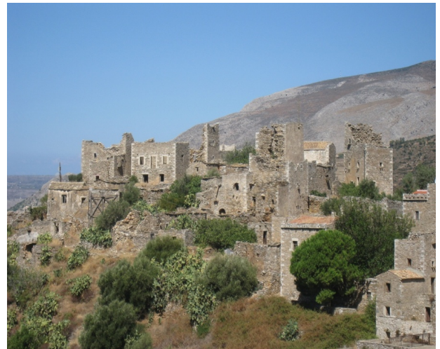
Het torendorp Vathia.

Van Gerolimenas zijn we naar het torendorp Vathia gereden.