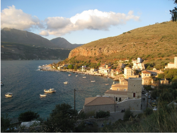
Limeni - Vissershaven

Binnen-Mani (Μεσα Μανη) onder Limeni. Boven Limeni spreekt men over de Buiten-Mani (Εξω Μανη). Om een beter beeld te kunnen vormen over Binnen- en Buiten-Mani is het interessant om de geschiedenis over de Manioten, hun laconieke manier van spreken en leven, hun cultuur en gastronomie te lezen.