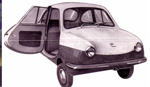
Links: Neorion uit 1974, geproduceerd op het eiland Syros