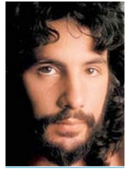
Steven D. Georgiou als Cat Stevens in 1972

Steven Demetre Georgiou, Στήβεν Δημήτρης Γεωργίου , geboren in 1948 als zoon van een Grieks-Cypriotische vader en een Zweedse moeder, is bij ons beter bekend als Cat Stevens. Hij behoort tot de meest getalenteerde muzikale poëten van zijn generatie. Sinds zijn debuut in 1966 scoorde hij tot het einde van de jaren 70 de ene hit na de andere. Zijn liedjes zijn dankzij hun eenvoudige melodieën en rijke teksten uiterst herkenbaar. Maar vooral zijn stem voert het publiek mee naar een andere wereld. Soms teder en beklijvend, soms licht en frivol weet zijn warme stem elke emotie over te brengen met een uitzonderlijke intensiteit. In 1978 bekeerde hij zich tot een andere geloofsovertuiging. Als artiest heet hij dan Yoriyos. Op zoek naar spiritualiteit keert hij de muziekwereld de rug toe. Tot hij bijna dertig jaar later in 2004 de muzikale draad terug opnam en als folkrockzanger zijn talloze fans opnieuw in vervoering brengt. Zijn terugkeer naar Brussel, in juni 2011, ging alvast niet onopgemerkt voorbij. En ook recent, in november 2014 gaf hij opnieuw het beste van zichzelf. Cat Stevens, goed voor meer dan 100 miljoen verkochte albums, is bij ons bekend met tijdloze songs en klassiekers als Moonshadow , Father and Son , Lady d'Arbanville , Morning has broken en Peace Train .