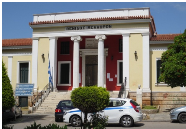
Chalkis - gerechtshof