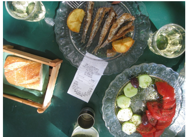
Pilos karafje wijn met meze voor slechts 6 euro

Om een idee te hebben van de prijzen hieronder een foto met het ticket erbij. Een karafje wijn, brood, een bordje met vers gegrilde sardienen en gebakken aardappeltjes en een bordje met tomaatjes, komkommer en een paar olijven en dit alles voor de ongelooflijke prijs van 6 euro! Moet er nog zand zijn?