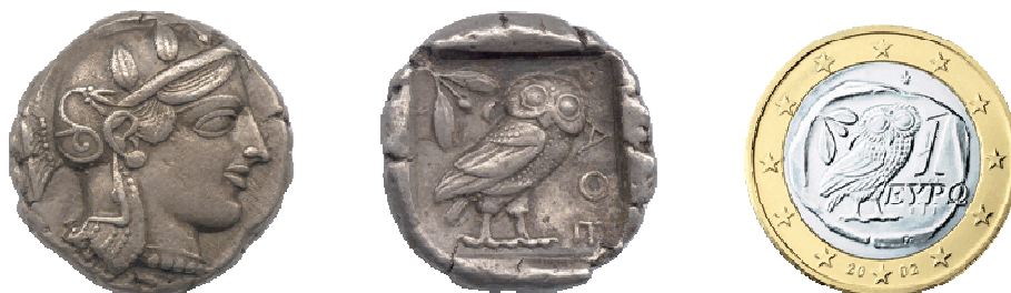
Links en midden: een antieke Atheense tetradrachme uit 450 vóór Christus met de afbeelding van Athena (voorzijde) en de uil (achterzijde)

Op de achtergrond zien we olijfgaarden en de zee.