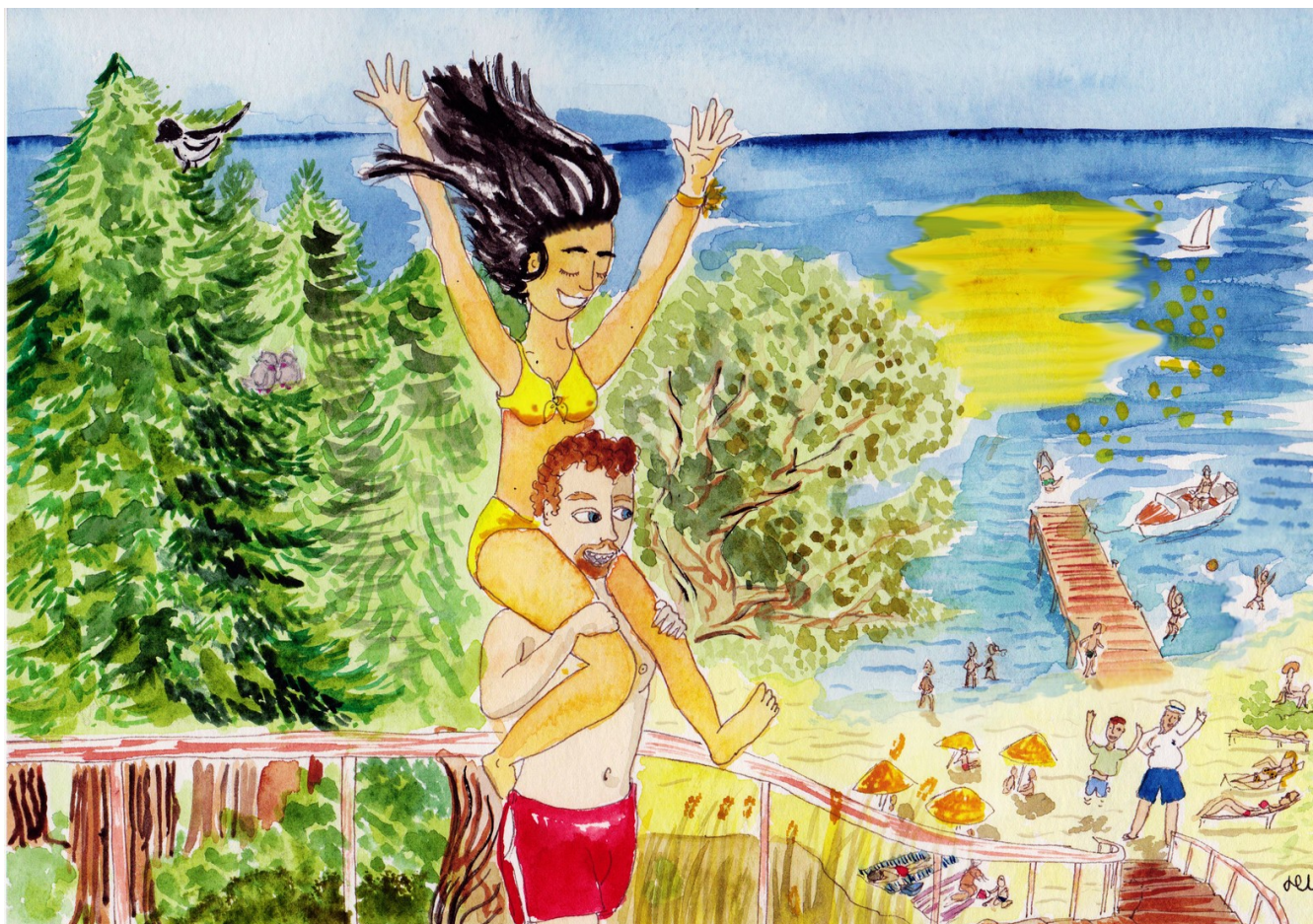
illustratie: Varka sto gialo (H. Isikli)