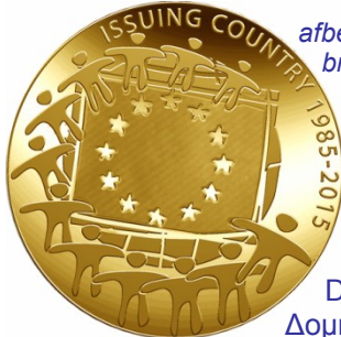
afbeelding: het Griekse ontwerp

Naast deze munt komt er in het najaar van 2015 nog een andere 2 euromunt ter gelegenheid van de 75 ste verjaardag van Ochi-dag op 28 oktober 1940. Oplage: 750.000 muntstukken. Voor de verzamelaars onder ons: dit is de 12 de Griekse uitgave wat betreft 2 euro herdenkingsmunten.