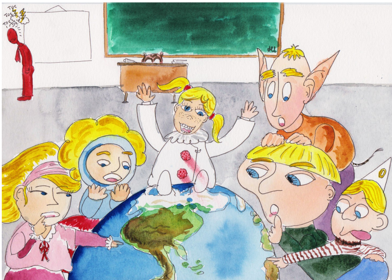
illustratie: een les aardrijkskunde - H. Isikli vertalingen: Carlos Thoon

Je zijt gelukkig, zegt de andere, de mijne leeft nog!