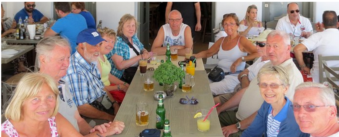
De voltallige groep

Tijdens de briefing vernemen we dat er 's anderendaags een verkenning van de hoofdstad Chora te voet voorzien is. Ook zullen er huurwagens gezocht worden voor de volgende dagen want dan wordt de rest van het eiland verkend.