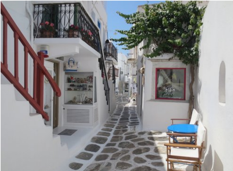
Typisch straatje in Chora

Als we klaar zijn komen we allemaal samen in Alexandra om van daaruit te vertrekken voor de verkenning van Chora. Gisteren, bij valavond, vermoedden we al dat in de onmiddellijke omgeving van de hotels niks te zien is noch te beleven valt. Nu, bij klaarlichte dag, zien we dat dit inderdaad zo is. We vertrekken te voet naar de hoofdstad; de kortste weg (ongeveer 1 km) gaat via een hoger gelegen wijk. Het straatje klimt eerst heel fel, biedt mooie overzichten op Chora en daalt dan geleidelijk naar de toegang tot de stad.