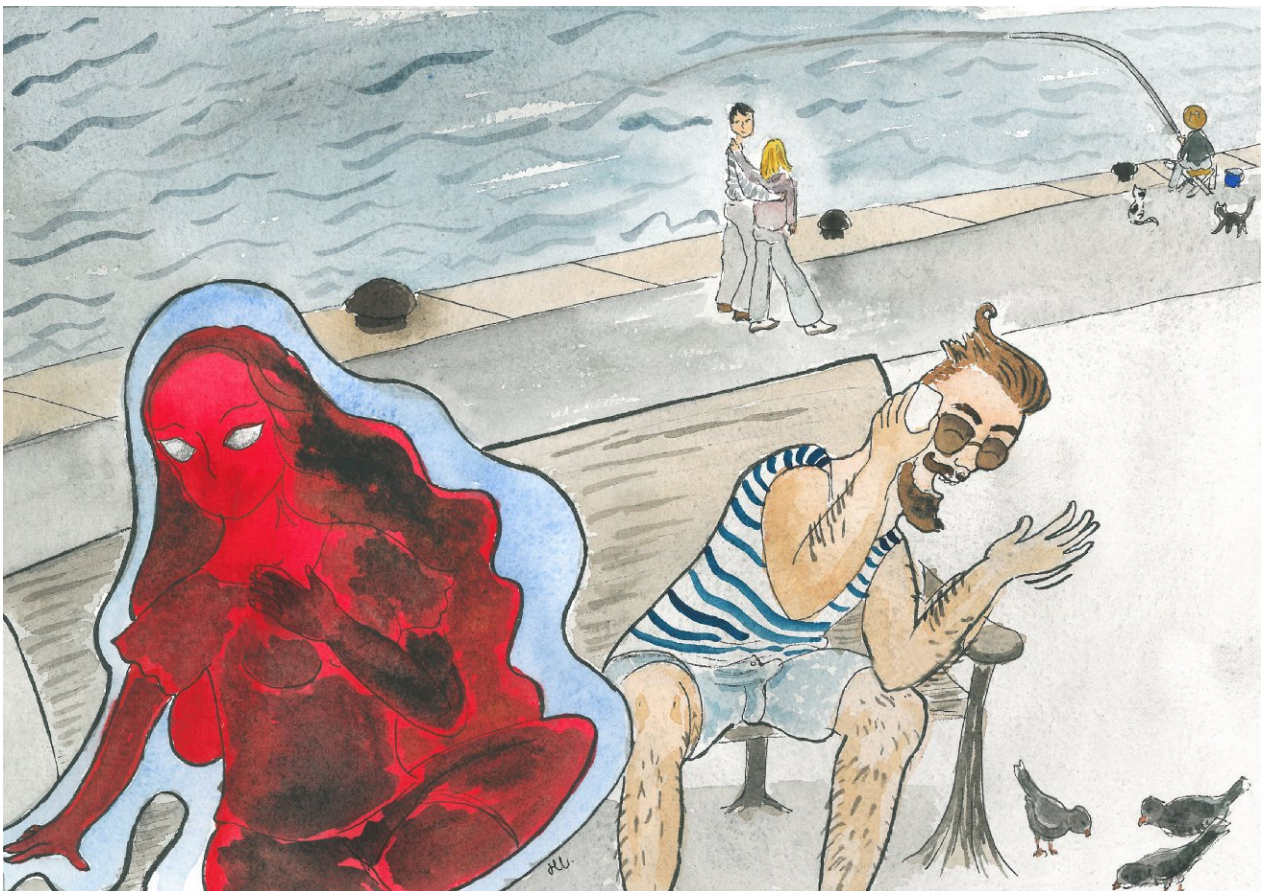
Ik vraag niet... (illustratie: H. Isikli)

Beluister dit lied op https://www.youtube.com/watch?v=gVGI9DWEtAg