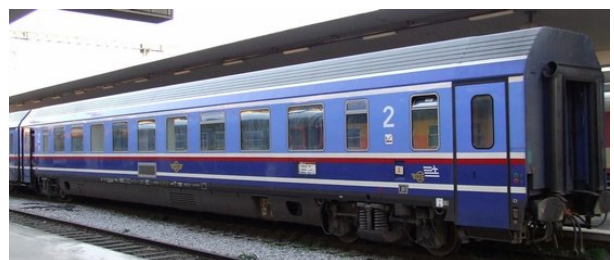
Een modern en comfortabel rijtuig van de Griekse spoorwegen die onder meer op de internationale verbindingen worden ingezet

De dagelijkse internationale treinverbinding Thessaloniki - Beograd werd recent (in mei) hernomen. Helaas besliste de Griekse treinoperator Trainose op 28 augustus die dienst opnieuw en voor onbeperkte tijd te stoppen. De vele migranten bevuilden ernstig de comfortabele rijtuigen en veroorzaken ook veel schade aan het interieur. De weinige echte treinreizigers die wel betalen worden per bus naar Gevgelija gebracht, het eerste station over de grens met het buurland (FYRoM).