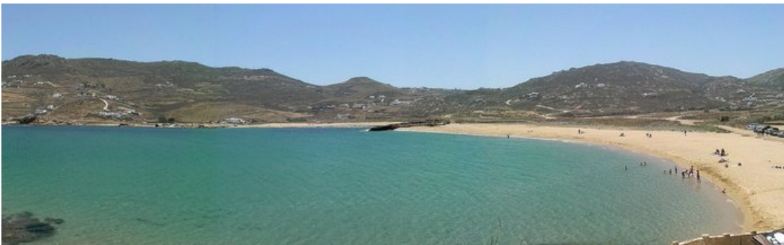
Strand van Ftelia

We besluiten dan maar verder te rijden om de rest van het eiland te verkennen. We rijden eerst noordwaarts, richting kust. De afstanden zijn zeer klein maar toch hebben we tijd nodig; de wegen zijn immers smal, met veel bochten en soms heel steil. We bereiken Ftelia, een kustplaatsje met heel weinig volk, enkel wat zonnekloppers. Wij bemerken een mooi strand maar er zijn weinig faciliteiten. Het enige restaurant oogt best gezellig en we willen er graag ons middagmaal nemen, maar de prijzen zijn schandalig hoog. We rijden liever terug naar Ano Mera om daar een restaurantje uit te kiezen. Er zijn er meerdere en ze zijn beduidend goedkoper.