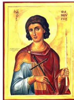
<< Icoon van de Heilige Fanourios

De cultus rond Agios Fanourios zou ontstaan zijn in de 14 de eeuw op Rhodos en van daaruit verspreid zijn naar eilanden. Agios Fanourios is het meest populair op Kreta.