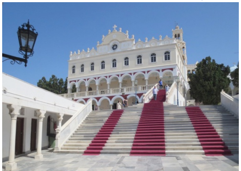
Tinosstad: kerk Megalocharis

Tegen 21 uur spreken we af bij de aanlegsteiger want de ferry vertrekt om 21.30 uur. De overtocht verloopt rustig maar bij het naderen van Mykonos worden alle passagiers in de autogarage samengetroept opdat er vlugger zou kunnen ontscheept worden. Daar heerst een hels lawaai van de krachtige scheepsmotor die aan het afremmen is en van de bijkomende motoren die de zware laadklep moeten neerlaten. We komen vermoeid aan in Mykonos. Na op en af rijden met het huurwagentje, worden we in de hotels afgezet; 't is dan al na 23 uur... De komende twee dagen zullen we noodgedwongen hetzelfde scenario moeten volgen.