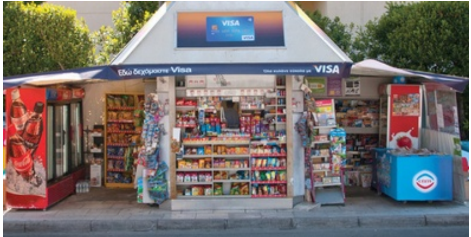
100 jaar geschiedenis: bescheiden oude (kranten)kiosk in Athene < > moderne kiosk die het ganze voetpad verspert in Thessaloniki

In woonwijken waren kioskeigenaars bekend bij iedereen. De eigenaar kende iedereen en wist alles wat er gebeurde op straat. Hij kon zijn klanten alles vertellen over de buurt en wist alle roddels, of hij besprak met zijn klanten de ontwikkelingen in sport en politiek. Vroeger kochten de mensen snoep en frisdrank in de kiosk maar toen de supermarkten die producten goedkoper verkochten was dat het begin van het einde voor de kiosken. Men kwam ook naar de kiosk om te telefoneren want velen hadden thuis geen telefoonaansluiting. De komst van de telefoon in Griekenland en de grote binnenlandse migratie in de jaren 50 en 60, gaven ook een grote boost aan de kiosken. Misschien herinner jij je ook nog die rode munttelefoons die je gebruikte om vlug eens naar het thuisland te bellen? De opkomst van de mobiele telefoons stelde ook daar een einde aan.