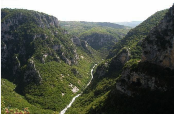
De Vikoskloof in Beloi groter dan de Grand Canyon De Vikos canyon :

Het dorpje Vitsa ligt in Centraal-Zagoria, aan de rand van de Vikoskloof, naast het dorp Monodendri. Het kan worden bereikt door naar beneden te lopen langs de geplaveide paden. Vervolgens steekt men de Misiou Brug over en volgt men de beroemde Vitsa trap uit de 17 de eeuw die leidt naar dit dorp. De locatie van Vitsa gaf het de reputatie van het balkon van de grote Vikoskloof, wegens het prachtige uitzicht!!! Eén van de meest opvallende kenmerken van het dorp zijn de traditionele stenen huizen gemaakt van hetzelfde type steen. Op het dorpsplein ziet u de grote 600 jaar oude plataan met zijn schaduw om een beetje te verkoelen. Het dorp herbergt ook een aantal zeer antieke muren die dateren van 2500 tot 2000 vóór Christus, de periode waarin oude stammen het gebied bewoonden.