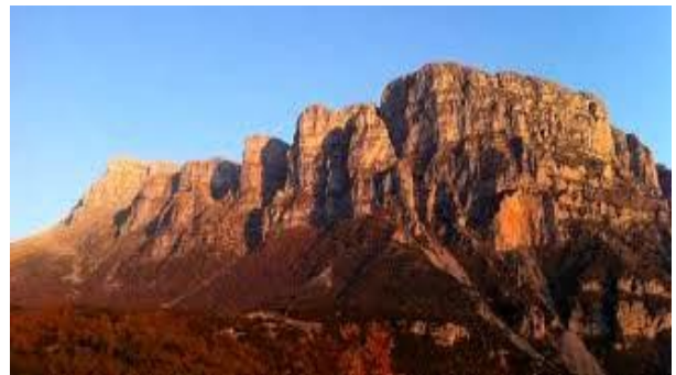
De Astraka berg (2.436 m)

film 60 minuten - de mooiste Zagoriadorpjes