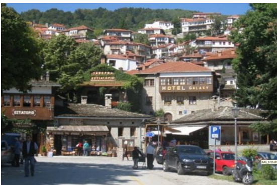
Het centrum van Metsovo

Alle taarten in Metsovo zijn zeer lekker zoals melktaarten, taarten gemaakt van kool en trachana (een traditionele soort pasta). Vergeet niet om van het lam te proeven samen met bloemkool, kontosoufli (aan het spit geroosterd varken, lam of geit) en de worsten. Als je de typische kazen wil proeven neem dan metsovone, metsovela en gruyère batzasio, vergezeld met tsipouro of lokale rode wijn. Metsovo is gekend voor alle soorten quiches, kazen en rode wijn.