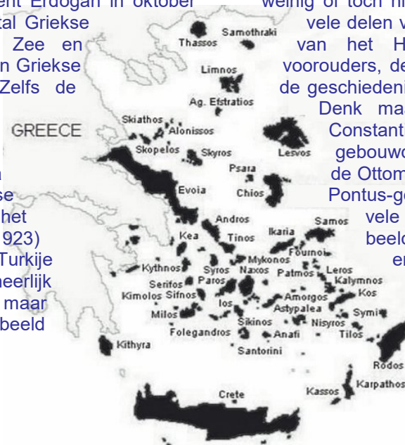
De droom van Erdogan

is het niet Griekenland die al die gebieden zou moeten terug-eisen...?