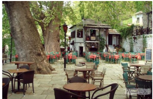
Dorpspleintje met oude platanen in Vizitsa

Op 16 september bezochten we Vizitsa en Milies in Pelion.