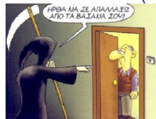
Nea Paralias 44 (oktober 2016) - pagina 22