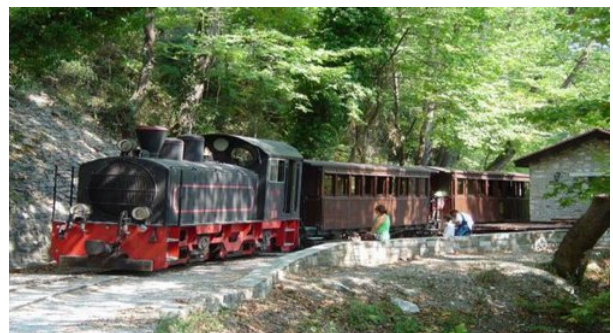
Het treintje van Milies

De volksarchitectuur van Pelion is hier te bewonderen in al zijn glorie! Het mooie en pittoreske Vizitsa ligt tussen Milies en Agios Georgios, op 30 km van Volos en met uitzicht op de Pagasitikos golf. Het is uitgeroepen tot een unieke streek en is gekozen door de Griekse Nationale Toerisme Organisatie (MGTO) voor de restauratie van oude herenhuizen en hun transformatie in pensions. Aangekomen bij de parkeerplaats van het dorp, vind je de kerk van Zoodochos Pigi (1725), en bergop de stenen kasseien volgend, vind je het plein met de platanen, waar het merendeel van de activiteiten van het dorp plaats vinden. Op het plein is er ook de overdekte stenen fontein Mousga, die voortdurend koud water biedt aan de bezoekers. Bij Milies zijn we gestopt bij Anna na ena milo om een goede verzorgde koffie te drinken, zeker een aanrader.