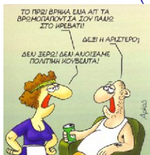
Nea Paralias 44 (oktober 2016) - pagina 21