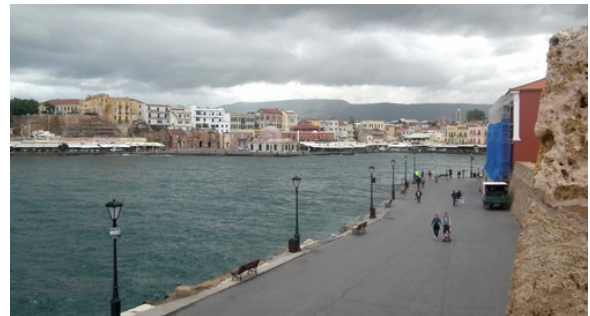
Donkere wolken boven de haven van Chania, gezien vanuit de Firkasburcht