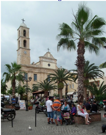
De kathedraal van Chania

We vinden er elkaar vlot terug en wandelen nu het oude centrum in. Snel komen we oog in oog te staan met de kathedraal Panagia Trimartyri die we meteen bezoeken. Tegenover de kathedraal bevindt zich de rooms-katholieke kerk en een volkskundig museum. Op het pleintje voor de kathedraal (Plateia Mitropoleos / Plateia Athinagora) zijn er heel wat tavernes. We kiezen er eentje uit om een kleinigheid te eten.