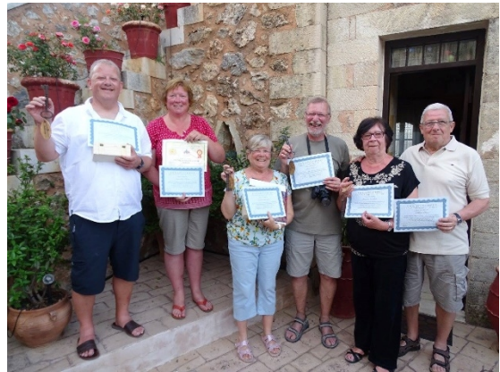
De aanwezige Yamassers (bron foto: Yamas)

bron: Griekse Club Yamas Bredene. Zie ook http://griekse-club-yamas.skynetblogs.be/ en http://www.facebook.com/griekseclubyamasbredene