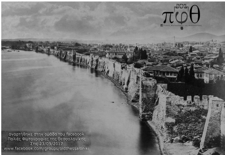
Een oude foto van Thessaloniki, toen de stadswallen zich nog op de kustlijn bevonden

Op deze Facebookpagina staan heel wat foto's van Thessaloniki uit de oude tijd: https://www.facebook.com/groups/oldthessaloniki