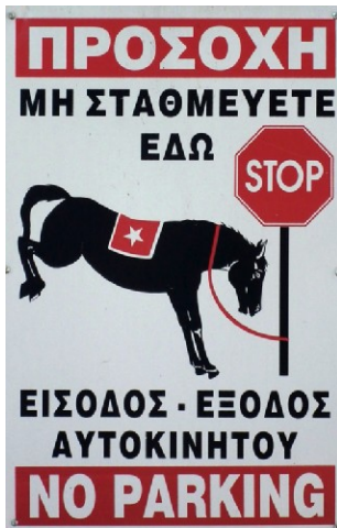
Leuk verkeersbord in Perivolia:

willen we nog een kleine wandeling maken in het dorp en enkele foto's nemen, maar plots vielen bakken water uit de lucht. Gelukkig was het maar voor eventjes.