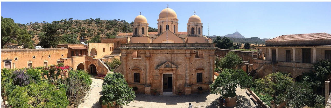
Het indrukwekkende klooster Agia Triadas