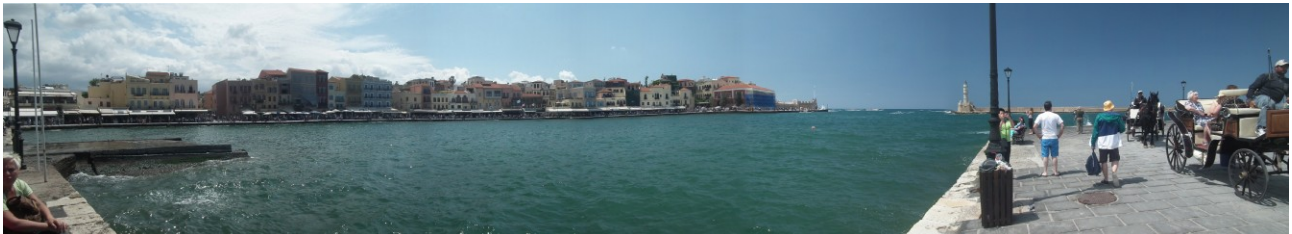
Panoramisch zicht op de haven van Chania