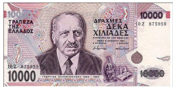
Papanikolaou op een Grieks bankbiljet uit 1995