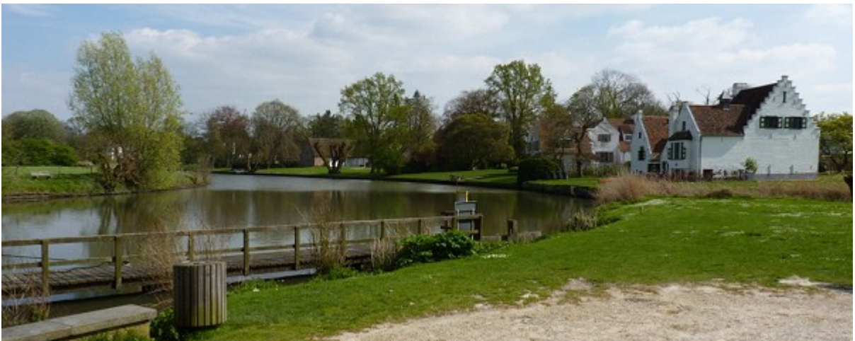
Langs de Leie, aan de steiger van Sint-Martens-Latem

Totale afstand: 36,4 km - We starten om 10 uur, einde voorzien rond 18.30 uur.