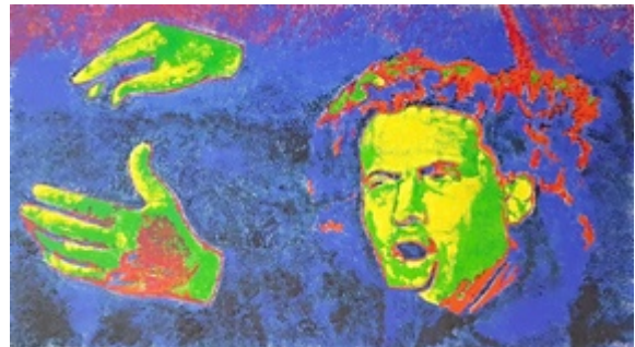
Schilderij 'Maestro Mikis Theodorakis'. Werk van Gaby Simoens als hommage aan de grootmeester. Acrylverf op paneel 58 x 32cm. Stond tentoongesteld in Eeklo op de avond van het concert. Klik op de link om de foto te vergroten : https://bit.ly/3TLQYZt

dienste kan stellen van de mooie Griekse muziek; muziek die op haar beurt de Griekse poëzie dient.